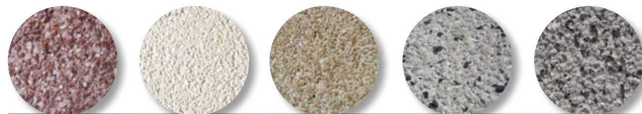
Porphyre rose Quartz blanc Calcaire jaune Hourtin Blanc / noir