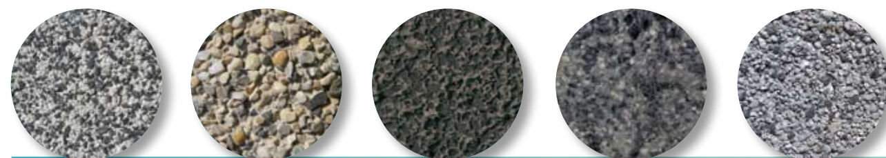
Granité Pierre Dorée Basalte Noir / blanc Granité 74