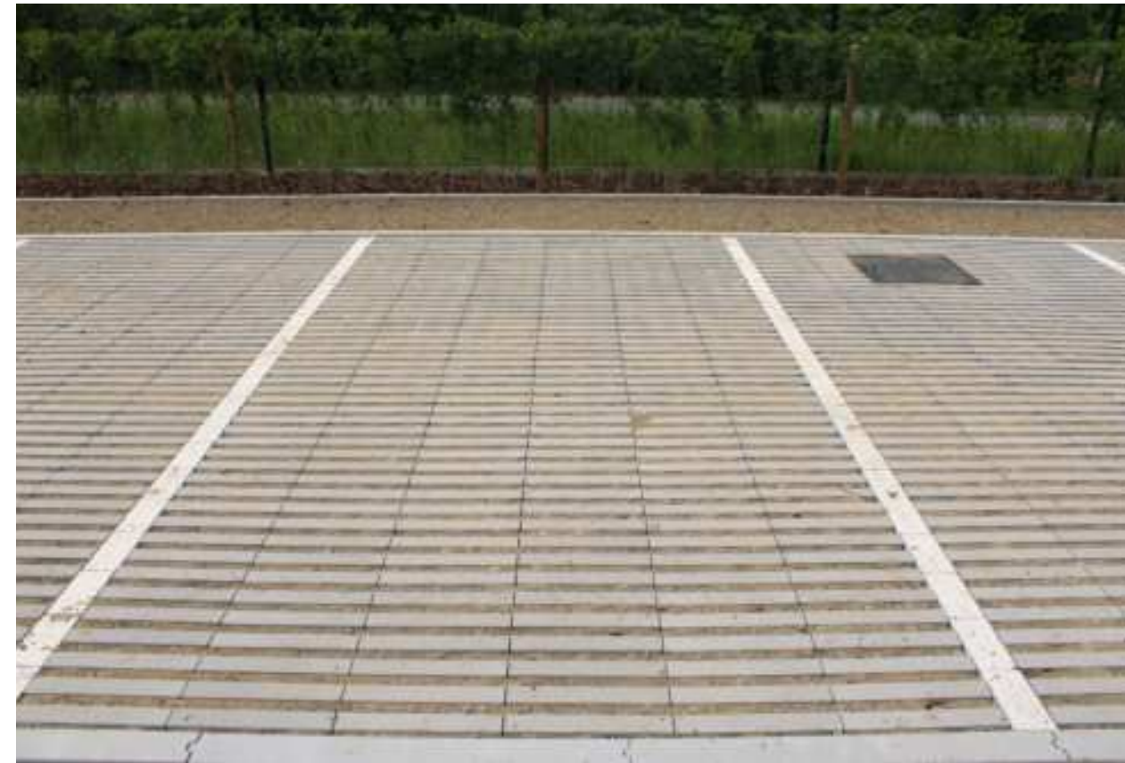
Project LinO'green parking- Zonnebeke