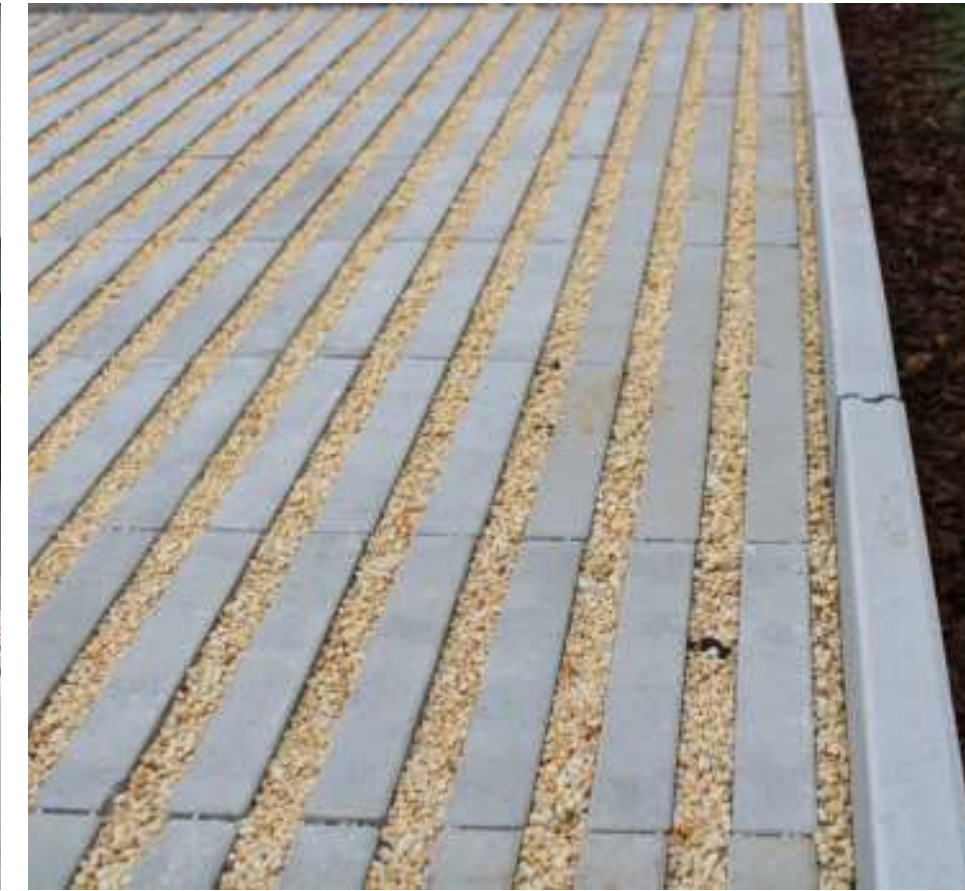
Project LinO'green Oprit - Waregem